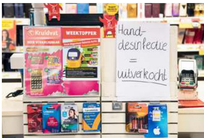
Een foto van De Kruidvat in Nijmegen

Fabrikanten van desinfectiemiddelen kunnen de enorme vraag niet meer aan. Bij veel drogisterijen is de desinfecterende handgel inmiddels uitverkocht.